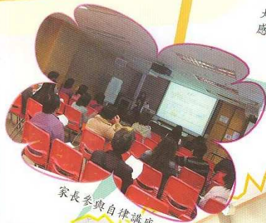
家長參與自律講座