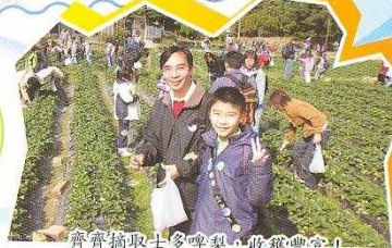
齊齊摘取士多啤梨，收穫豐富！