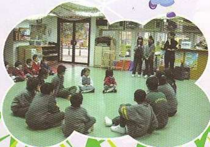
義工隊探訪幼稚園