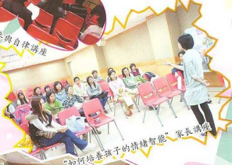
“如何培養孩子的情緒智能”家長講座