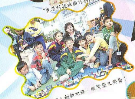
等待機械人創新紀錄，既緊張又興奮！