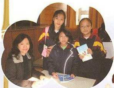
作家君比寫作講座