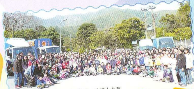
親子一天遊大合照

數算過去半年，本會已經舉行多項親子活動、講座及工作坊，各項活動參加人數非常踴躍，其中包括去年十月二十日第二屆家長教師會周年大會及執行委員會選舉，有關執行委員成員詳見附表。另外，由於聖誕節期間，學校在寅森禮堂內進行冷氣工程，只好將原定一年一度的“聖誕聯歡晚會”暫停。為了讓會員可以早點相聚，大家可享受和珍惜與孩子共渡歡樂的機會，和給子女留下美好的回憶，唯有提早舉行“親子一天遊”。現將本會近期舉辦不同類型的活動花絮，讓大家一起欣賞和回味。