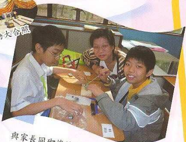
與家長同砌機械人，親子活動樂趣多