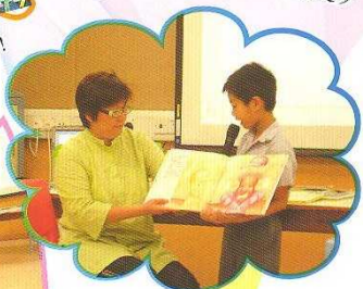
孩子勇於嘗試一起講故事