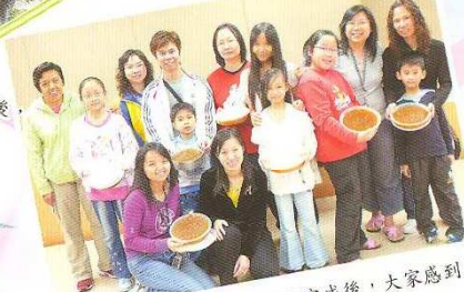
親子齊齊煮——馬蹄糕食品完成後，大家感到非常滿足！