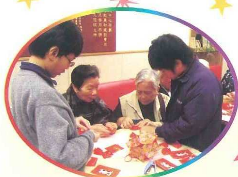
與長者一同製作賀年飾物