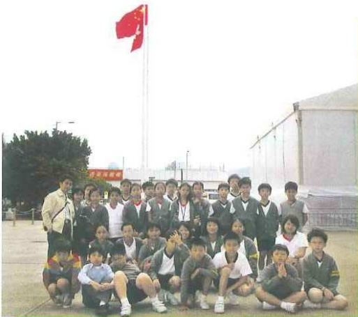
國民教育之參觀金紫荊廣場升旗儀式