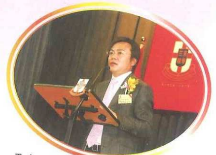
壬午年主席馬鴻銘博士致詞