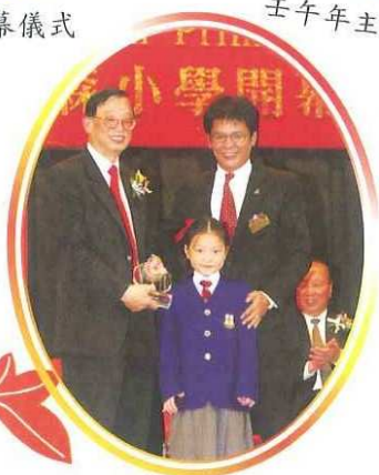
學生代表向教育統籌局首席助理秘書長潘忠誠致送紀念品