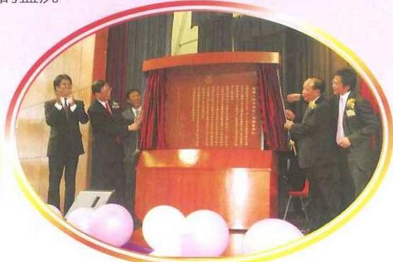
主禮嘉賓進行揭幕儀式