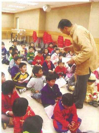
新年新希望 主題學習活動