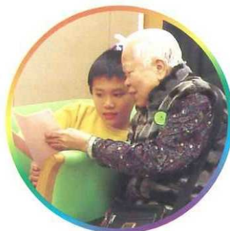
與長者同唱賀年歌