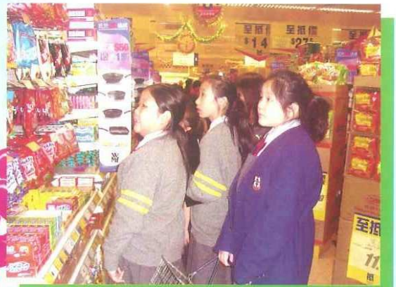
通識課之購物fun fun fun