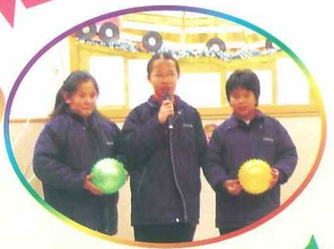
學生義工負責帶領遊戲