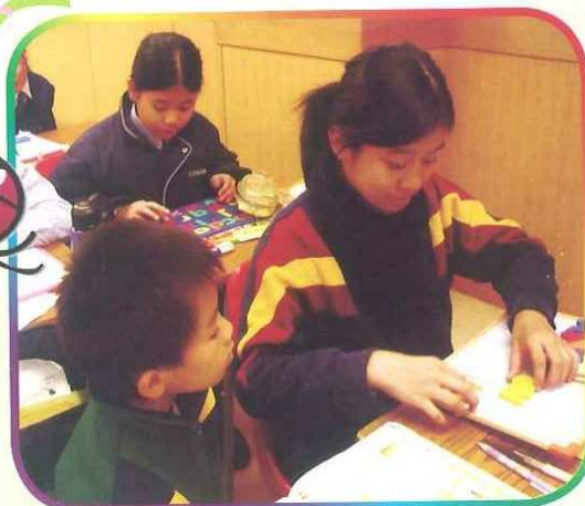
「小老師」指導「小同學」