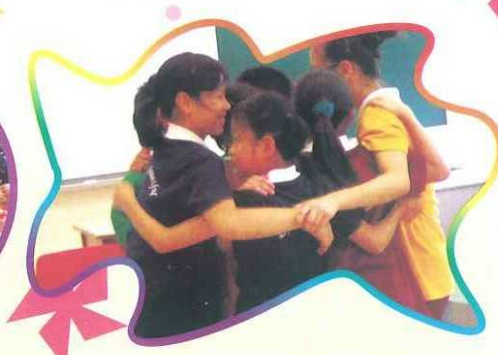
「義工先鋒隊」訓練合作精神