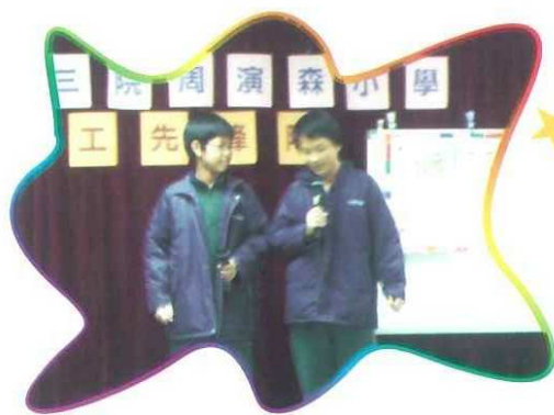
「義工先鋒隊」到幼稚園舉行聖誕活動

在這次探訪，看見義工們從毫無準備到有自信地站出來說話，看見他們遇到問題時能解決困難，也看見他們耐心地與長者談話，相信他們已學習到要學懂的東西。