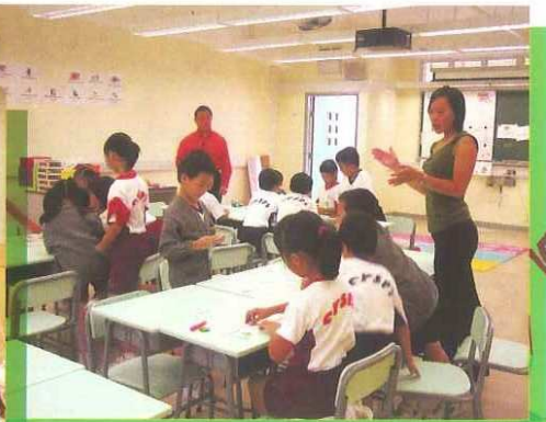
小學英語識字閱讀計劃