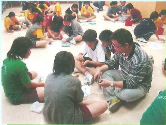
通識課之科學探究活動