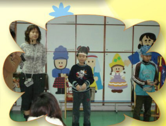
在幼稚園裡，同學們以普通話演繹得十分出色