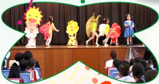
幼稚園同學正在表演話劇

國際間 將每年的4月23日定為「世界閱讀日」，希望藉著這個重要的日子，向大眾推廣閱讀和寫作，以及宣揚跟閱讀關係密切的版權意識。