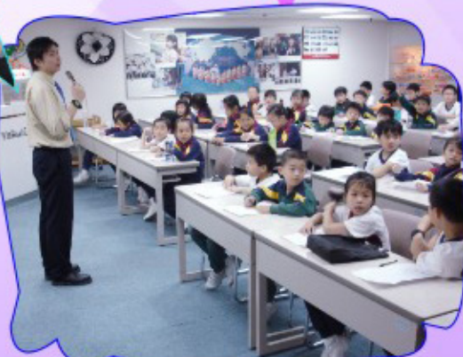
參觀香港益力多乳品有限公司