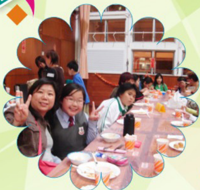
新春團拜晚宴上盡顯親子情