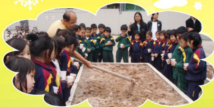
同學們正專注地看種植示範