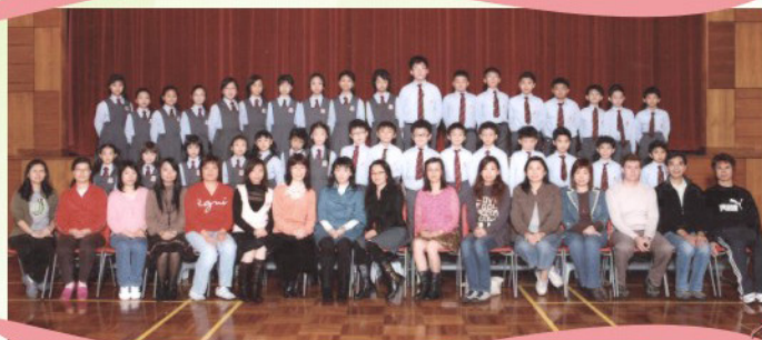
你們看！我們的“故事歡樂時光”成員陣容鼎盛