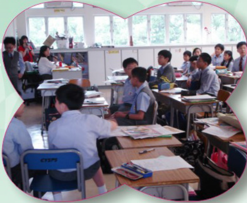
知識問答比賽很刺激呢!