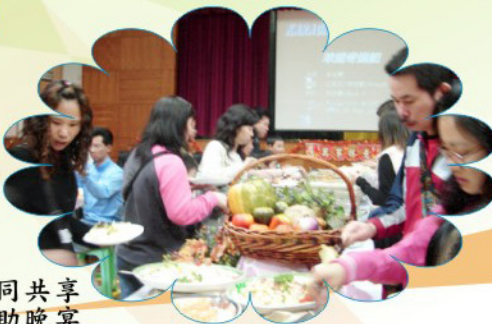
大家一同共享 新春團拜自助晚宴