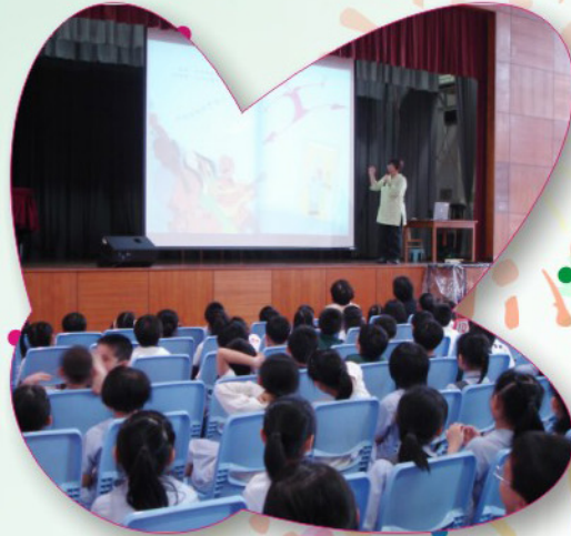
聽! 蔡姨姨正在講故事啊!