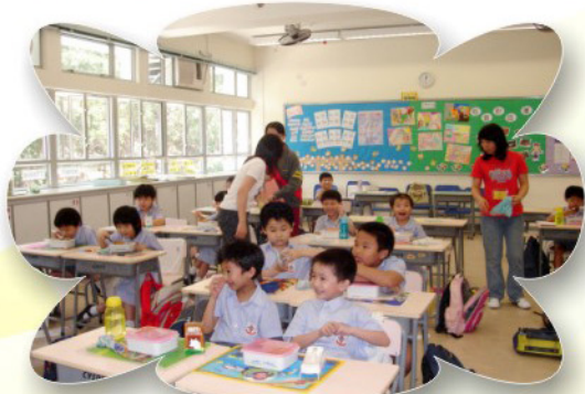
午膳家長義工每天都細心地照顧初小孩童，誠邀您們加入我們的行列