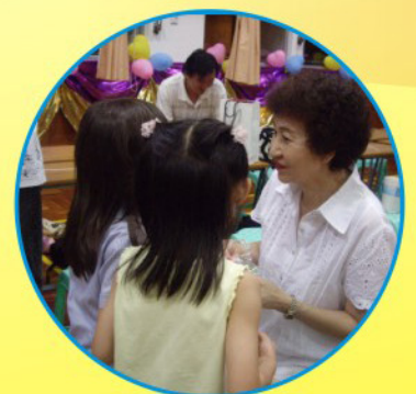
學生親自向老師奉上本會精心製作的心意禮物