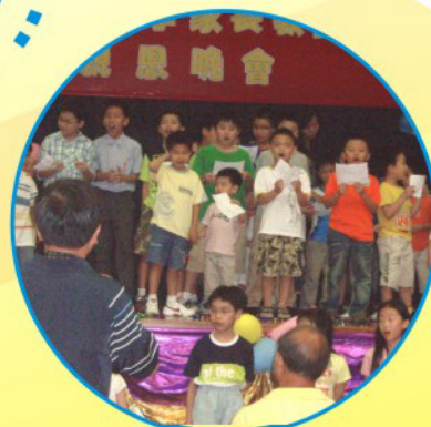
參加的學生向老師獻唱“良師頌”以表達對老師的敬意