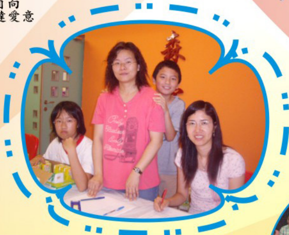
頌親恩晚會中，老師、家長和學生負責招待