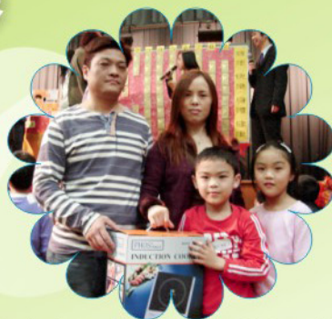
哇！晚宴上獲得大獎的其中一個家庭，運氣真好！