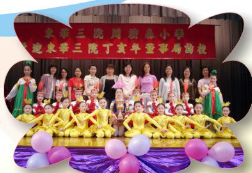
家長義工協助舞蹈組學生演出