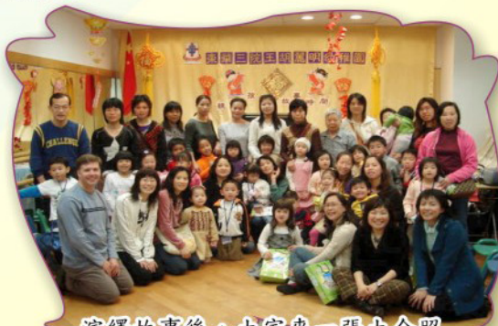
演繹故事後，大家來一張大合照