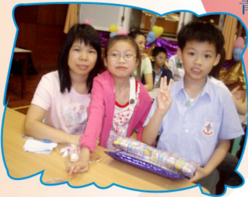
各兒女親自向父母親表達愛意

此外，我們經常反覆的思量，怎樣才可以把家長教師會的素質提升呢？本會希望透過各類名目的家長講座和工作坊，讓家長可以與孩子一同學習，一同成長，讓我們獲得更有效的育兒方法，使我們的家庭更和諧、更幸福！因此，希望來年，你們能成為我們家長義工新力軍。