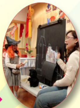
“巫婆與黑貓”故事以英語演繹