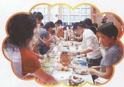
頌親恩晚會當晚，既溫馨又難忘