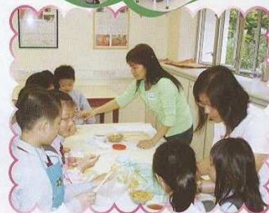
“情牽香港心” 主題教學週一家長義工