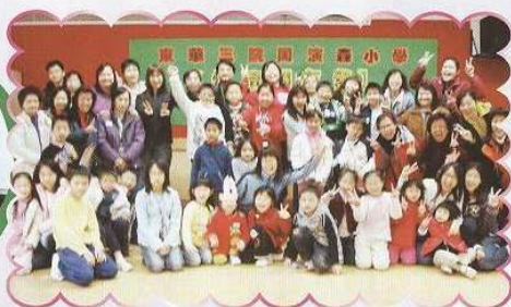
親子閱讀營大合照