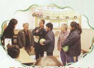
義工先鋒隊探訪長者中心