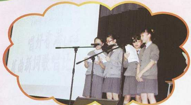
舊曲新詞創作比賽