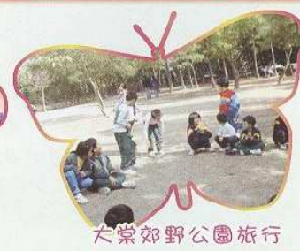
大棠郊野公園旅行