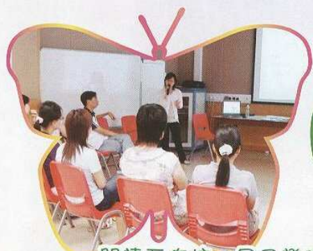
閱讀工作坊，足已證明家長也樂於學習