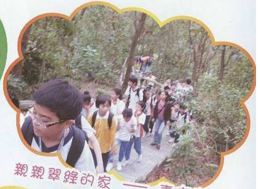
親親翠綠的家 —— 青衣家樂徑