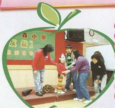
大家合作演出，十分投入