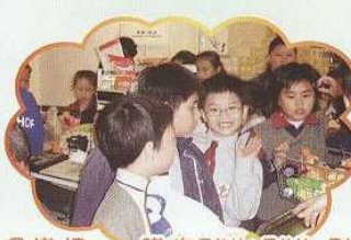
通識課——購物FUN FUN FUN