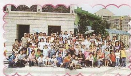
親子一起遊山玩水，吃喝玩樂，留下美好回憶