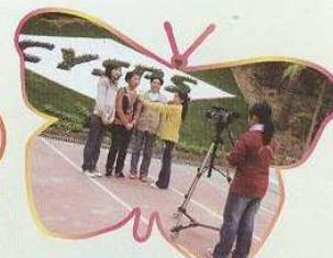
製作校園電視台節目