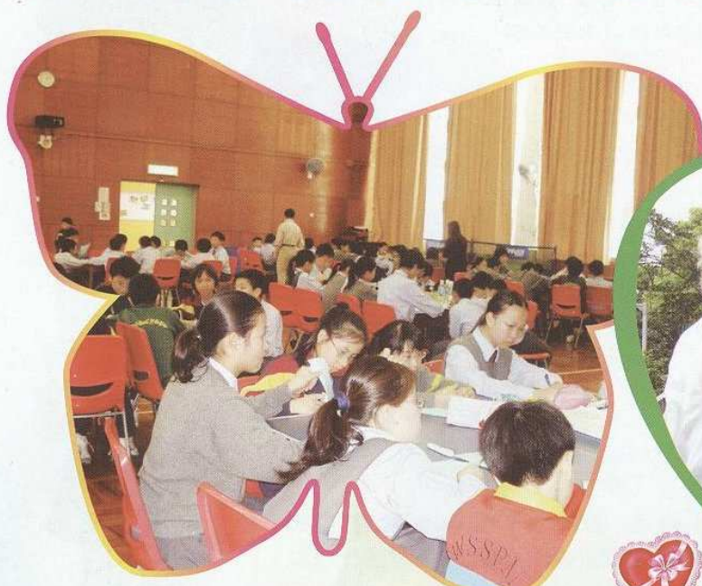
「心目中的美麗香港」繪畫製作

是次綜合週得以成功，除了老師的心血設計外，有賴一班家長義工的協助，家長義工擔當了重要角色，尤其在戶外活動中，家長義工對同學悉心照顧，及抽出寶貴時間預備和製作童年美食等，實在難能可貴。此外，社區資源也不可缺少，例如學校與深水埗明愛長者中心合作、邀請區內幼稚園一起參與活動等，都是成功和有價值的嘗試。