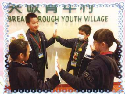
組員透過遊戲訓練「正向思維」