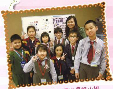
「喜樂兵團」正向思維小組