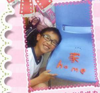
「笑」能為我們提供力量

各位同學，你們有聽過「黑貓、白貓」思想嗎？梅姑娘最近和部份參與「喜樂兵團」的同學不斷談及「黑貓、白貓」，大家在不同的遊戲和活動中也開始建立白貓思想了！那麼你們又想知道甚麼是「白貓思想」呢？就讓我在這裡用兩則故事和大家分享吧！