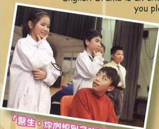
「醫生，你們想到了什麼辦法？」