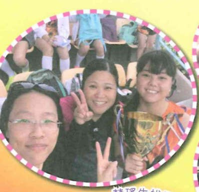
楚瑤先拔頭籌奪冠

本校田徑隊於兩項大型體育賽事中發揮高水準表現！經過多個月艱苦的訓練，同學們以最佳狀態於2017年11月3日「東華三院小學聯校運動會」發揮優異表現，個人獎項奪得3冠1亞2季及1殿的佳績。而在4X100接力賽中，「女子丙組」奪得季軍，「男子乙組」除了奪冠，更打破大會紀錄呢！而緊接著的是11月7日「香港學界體育聯會青衣區小學校際田徑比賽」，同學們更是越戰越勇，個人獎項奪得1冠3亞3季及4殿的佳績。而在4X100接力賽中，「男子乙組」亦再次奪冠，「女子甲組」及「男子乙組」同時奪得團體季軍。