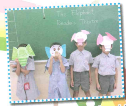
Students made their own masks and did a reader theatre in class.