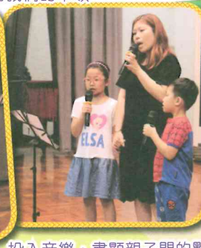
投入音樂，盡顯親子間的默契