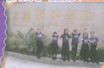
菁英輩出的音樂學府