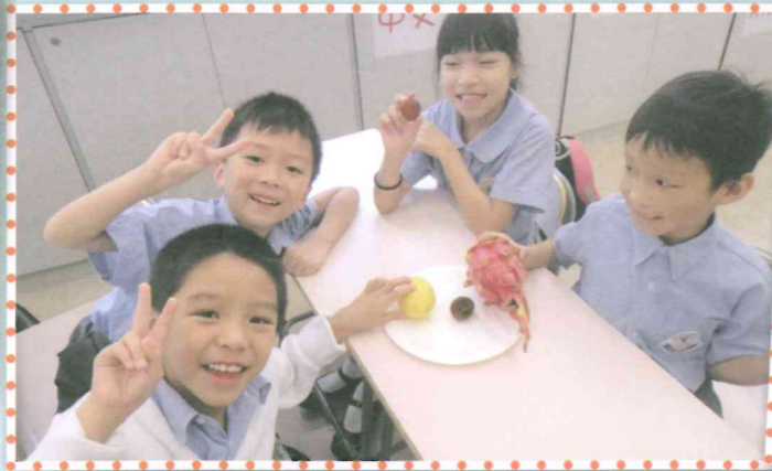
學習是可以很愉快呀！