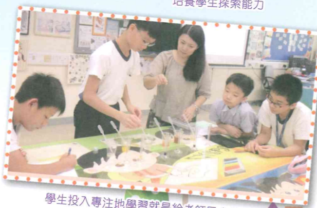
學生投入專注地學習就是給老師最大的回報