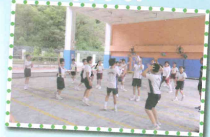
Students were divided into two teams and competed with one another.

Last year, we successfully held the REAL programme in our school campus. Thirty Primary 4 to 6 students were able to participate in the programme. They were engaged in a 6-hour course, consisting of trying out sessions and reading sessions. Other than having a try on how rugby is played, all students had a lot of chances to communicate and interact with the English native speaking coaches. Don't you find learning English through a sport is fun?