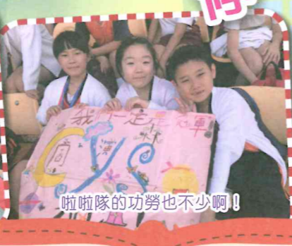
啦啦隊的功勞也不少啊！