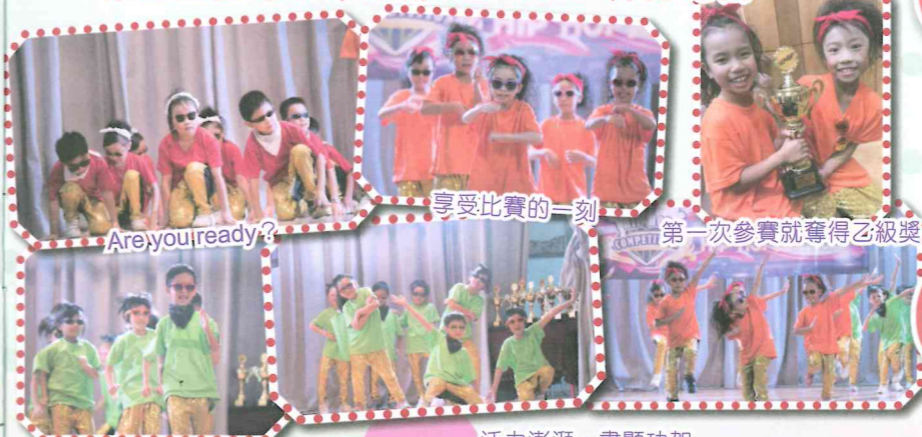
威風的小伙子出場了！