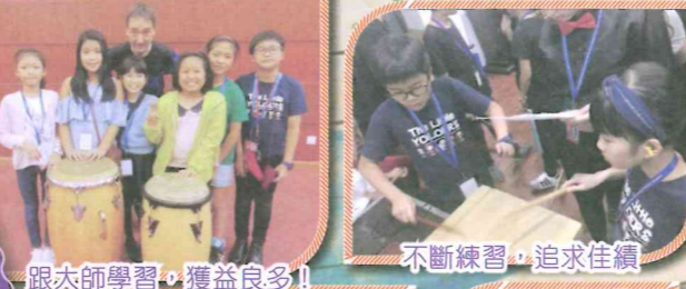
跟大師學習，獲益良多！