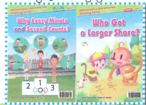
The storybooks about different Maths concepts.

In English lessons, students also learn by doing. Students have a lot of fun making a wired sandwich when they learn about recipes. They also enjoy making a real mask after reading a set of instructions. They even try out a school mini Olympic Games to learn about the different Olympic events.