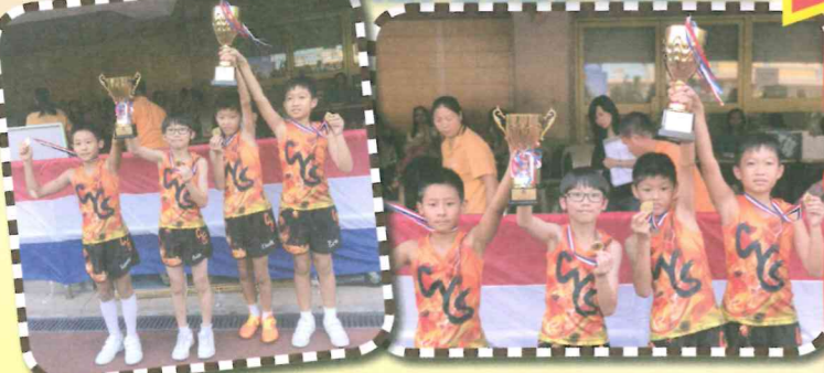
四小子勇奪男子乙組接力賽冠軍，還勇破大會紀錄！

本校田徑隊於兩項大型體育賽事中發揮高水準表現！經過多個月艱苦的訓練，同學們以最佳狀態於2017年11月3日「東華三院小學聯校運動會」發揮優異表現，個人獎項奪得3冠1亞2季及1殿的佳績。而在4X100接力賽中，「女子丙組」奪得季軍，「男子乙組」除了奪冠，更打破大會紀錄呢！而緊接著的是11月7日「香港學界體育聯會青衣區小學校際田徑比賽」，同學們更是越戰越勇，個人獎項奪得1冠3亞3季及4殿的佳績。而在4X100接力賽中，「男子乙組」亦再次奪冠，「女子甲組」及「男子乙組」同時奪得團體季軍。