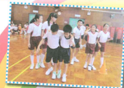
Students gathered in the hall and held a school mini Olympic Game day.

We can always learn English with great fun!