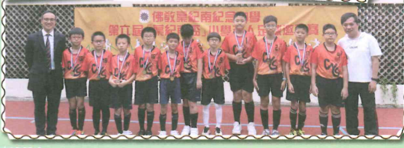
勇奪佳績，不遺餘力