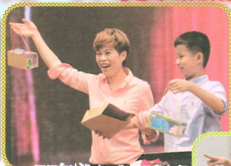
媽媽投入演出，為兒子打打氣！