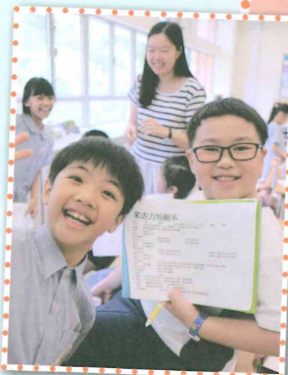
課堂上每張笑臉都是學生喜愛學習的見証