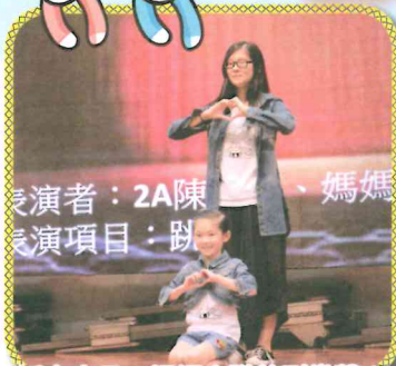
表演者：2A陳...、媽媽 表演項目：跳