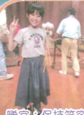
晞宜：保持笑容是取勝之道