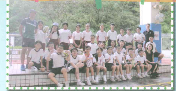
All students had fun playing rugby!

Everyone knows the more English exposure you have, the better English you can speak. Thus, students are always busy with the main curriculum, learning the core content, reading books, revising for quizzes and dictations, etc. Does one notice that there is also another way to learn English? Think outside the box. We do not only learn and use English in English lessons. How about learning English through playing a sport or by doing experiments?