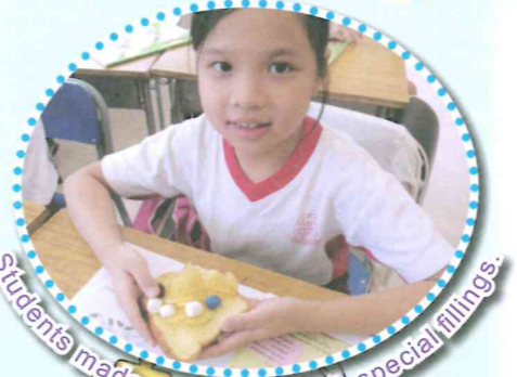
Students made a sandwich with special fillings.