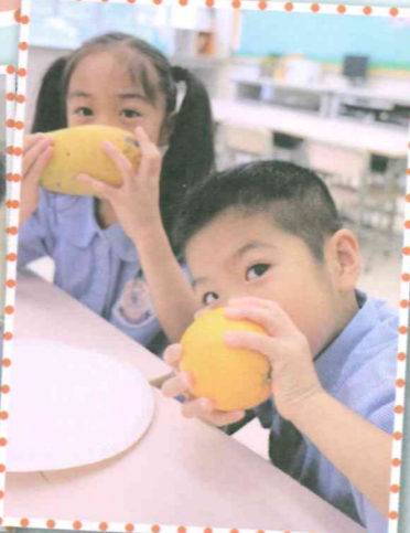
透過視、嗅和觸三個感官培養學生探索能力