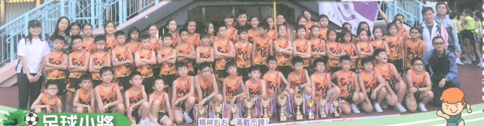
精神起起，滿載而歸！