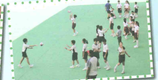
Students had a chance to try playing rugby.