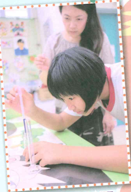
看！同學多專注及投入學習