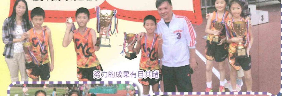
努力的成果有目共睹