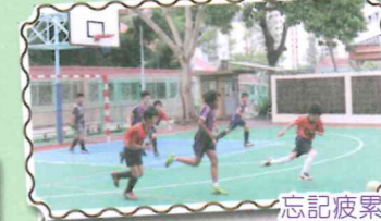
忘記疲累，全力以赴！