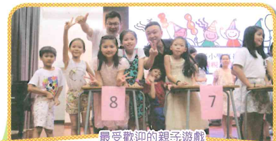
最受歡迎的親子遊戲