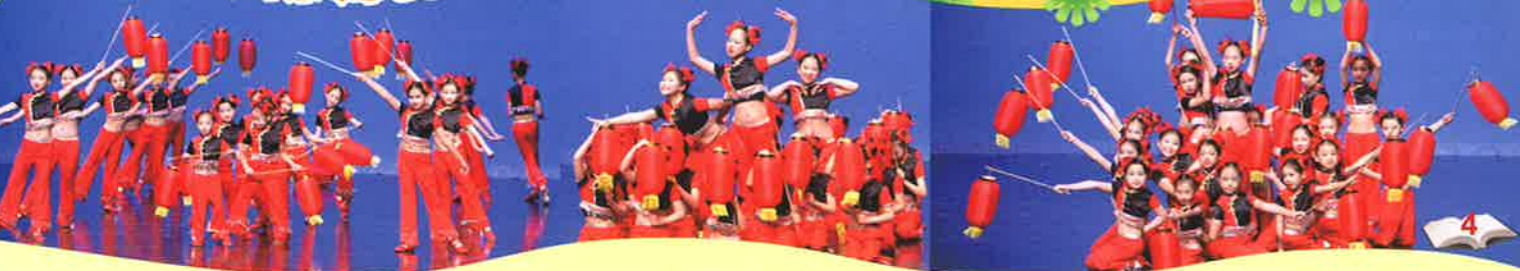
舞姿翩翩，每個舞步都表現組員的默契！