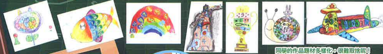
同學的作品題材多樣化，很難取捨呢！

本校「演森廣場」的改建工程已接近完工階段，新一系列跳飛機即將誕生，稍後我們將舉行一人一票選舉，挑選大家喜歡的跳飛機。入圍佳作將繪畫在「演森廣場」上，讓大家動起來，增添校園的朝氣！現在先睹為快，看看是威風凜凜的機械人，還是可愛的彩虹魚受歡迎吧！