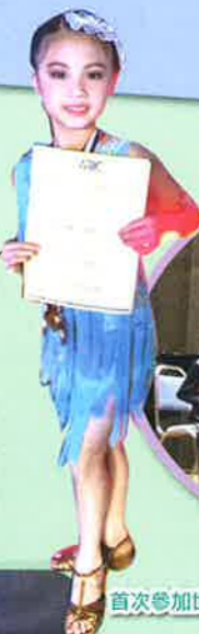
首次參加世界賽便獲得最高榮譽

在這次北京世界賽之旅中，我感到非常難忘及開心，除了可以讓我大開眼界外，還能結識了一班志同道合、熱愛拉丁舞的朋友，閒時我們會互相交流及學習。比賽過後，終於可以鬆一口氣，到處參觀了很多名勝古蹟，盡情地吃喝玩樂，整個旅程所學到的經歷讓我獲益良多。