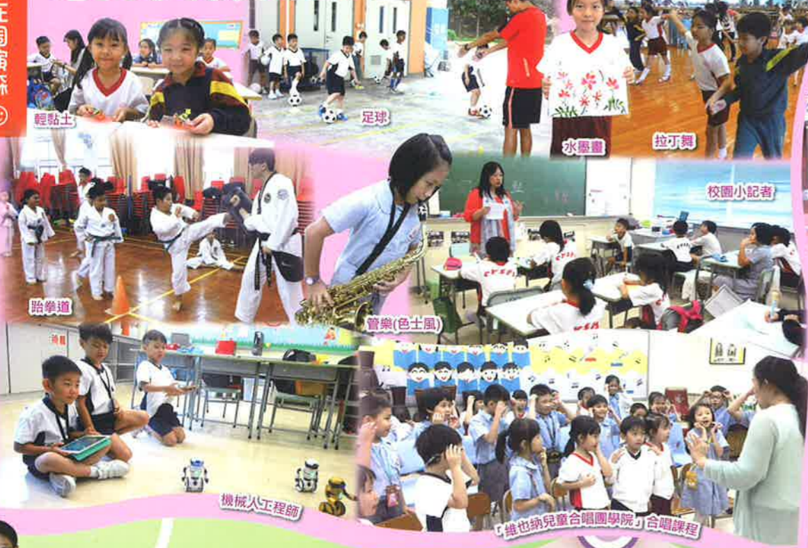
輕粘土 足球 水墨畫 拉丁舞