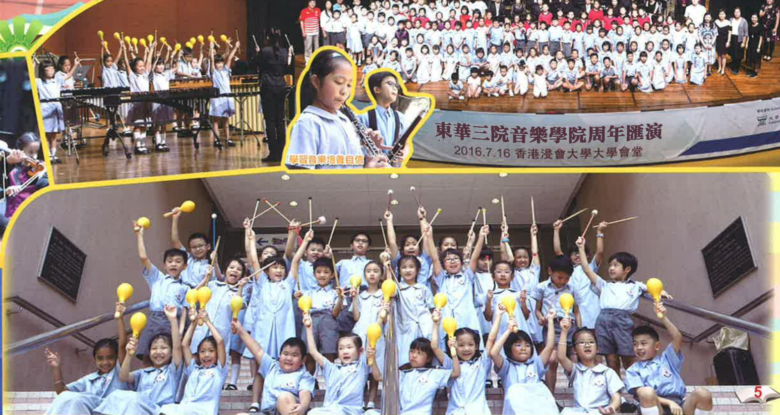
學習音樂培養自信