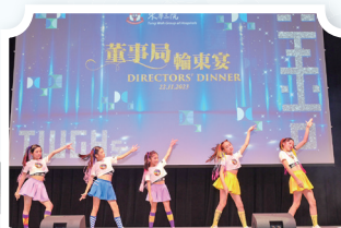
K-pop舞隊在輪東宴上精彩的演出