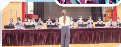
手鈴隊參與演森嘉年華演出及參加比賽情況