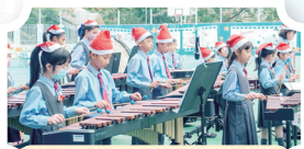
敲擊樂隊在演森嘉年華中表演

本校發展多元音樂課外活動，讓學生「從實踐中學習」，並於不同音樂活動中展現才能，成績卓越。