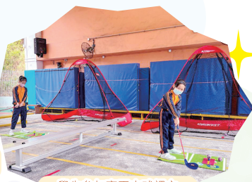
學生參加高爾夫球課之「高Fun小球手」入課計劃