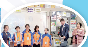
於Port Stephens的 St. Philip's Christian College作學校交流