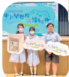
全民共讀閱讀日 宣誓典禮

本校鼓勵學生透過閱讀擴闊視野，增進知識，因此積極舉辦不同種類的活動，例如多次舉辦親親小讀者——作家講座及簽名會，藉着與作家會面，增加學生的閱讀興趣及閱讀動機。