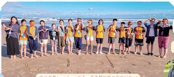
前往海灘Anna Bay，拍下一張美麗的照片留作紀念！