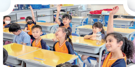
同學聽家長講故事多投入