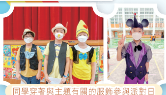
同學穿著與主題有關的服飾參與派對日