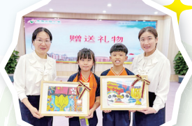
本校的學生送上自己的畫作予姊妹學校留念