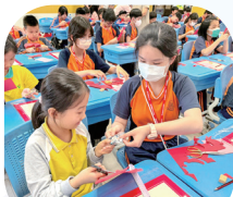
本校學生與姊妹學校——南海實驗小學的同學一齊上剪紙課