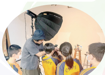
勿打擾，研究如何調較光度中……