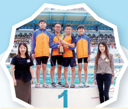
男子甲組成員於東華三院聯校游泳比賽獲得全場總冠軍