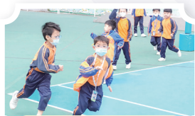
學校推廣小息輕鬆跑，鼓勵學生天天運動