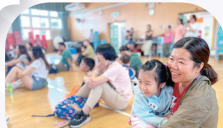
齊來聽故事增進親子感情