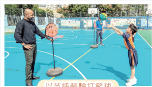
以英語體驗打籃球