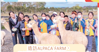
造訪ALPACA FARM，與羊駝、綿羊和牛親密接觸。