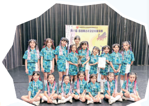
K-pop舞隊參加第17屆青少年及幼兒藝術節