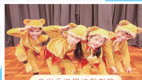
參與香港學校戲劇節

英語能力較佳及有表演天份的同學會獲邀參加英語話劇隊，同學每年都會作公開演出。在外籍老師的指導下，各成員於演出時均將角色演繹得活靈活現，英語能力也在不知不覺間有所增長呢！