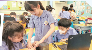
同學結合Micro:bit和感測器製作「智能澆水器」。