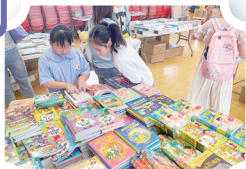
你選到心愛的圖書了嗎？