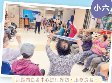
到區內長者中心進行探訪，服務長者。