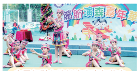
中國舞隊在繽紛演森嘉年華中表演

本校多年致力推廣舞蹈，成立中國舞隊及K-POP舞隊，在發展多元舞蹈方面不遺餘力。中國舞隊每年均有參加香港學校舞蹈節，多年來成績卓越，曾獲取優等獎及甲級獎。K-POP舞隊均每年參加全港小學校際 Hip Hop 舞比賽，曾多次獲取金獎，成績令人鼓舞。