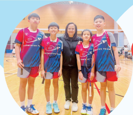
羽毛球隊個個身手好榮獲學界男子組團體冠軍