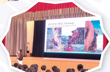
同學認識攀岩運動員的工作。