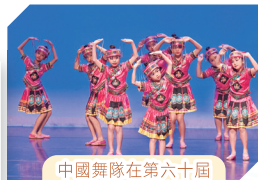
中國舞隊在第六十屆學校舞蹈節比賽情況