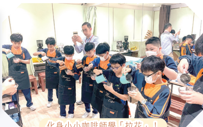
化身小小咖啡師學「拉花」！