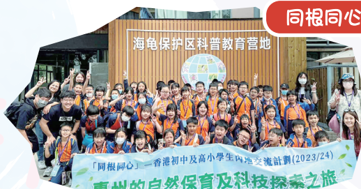
同學們到訪惠東海龜國家級自然保護區，了解國家的保育措施