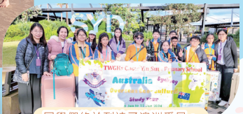
同學們終於到達了澳洲悉尼，行程非常精彩！