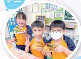
「煮意·心意」——同學自己製作一份食物，送給為他們付出的人，學習感恩。