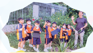
與外籍老師一同到花園認識植物