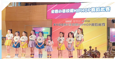
K-pop舞隊參加第七屆全港小學Hip Hop舞比賽