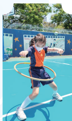
學校推廣動感運動場活動，學生進行呼啦圈挑戰