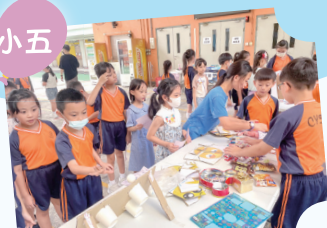
設計「認識情緒」的攤位遊戲，供同學參與和學習。