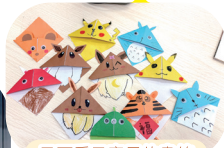
又可愛又實用的書籤