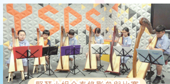
豎琴小組合奏錄影參與比賽