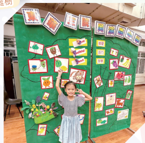
2324葵青展 混合媒體 (輕黏土卡通畫)