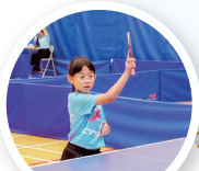
乒乓球隊員在比賽場上大顯身手