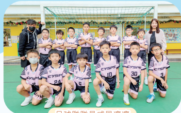
足球隊隊員威風凜凜