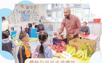
體驗到超級市場購物