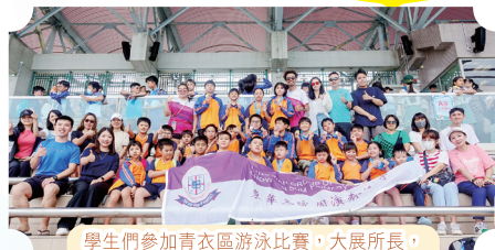
學生們參加青衣區游泳比賽，大展所長，家長到場全力支持