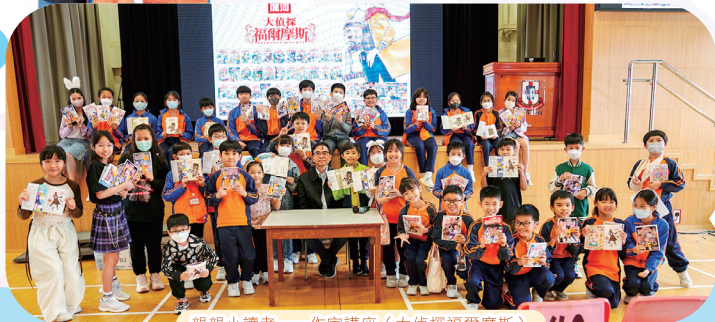
親親小讀者——作家講座 (大偵探福爾摩斯)