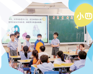
為低小學同學製作繪本及說故事，讓同學明白「勤勞」的重要。