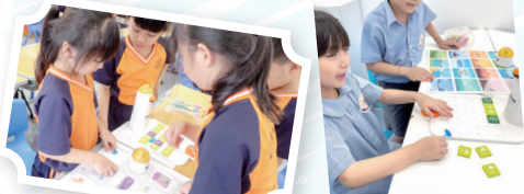
低小同學學習使用Matatalab編程，好玩又有趣！