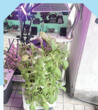
人工智能垂直耕作裝置。