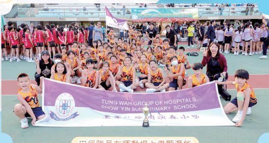
田徑隊員在運動場上盡顯潛能