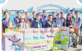
悉尼歌劇院——這座世界知名的建築是悉尼的地標！