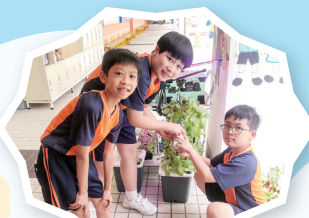
學生學習以人工智能垂直耕作技術，用心照顧小菜菜。