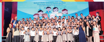
表現出色的合唱團成員加入東華三院兒童合唱團遠赴馬來西亞交流及演出