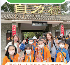
同學們參加開平新會考察之旅