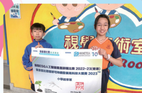
本校參加首屆「ESG人工智能垂直耕作比賽」，榮獲全港季軍。