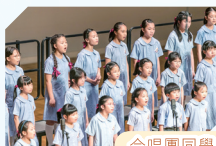
合唱團同學參與音樂會演出