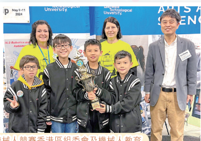
本校學生參加世界奧林匹克機械人競賽香港區組委會及機械人教育協會舉辦的機械人「冬季」挑戰賽2024