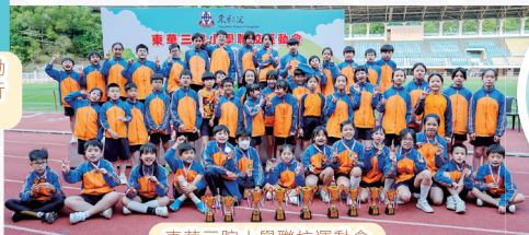
東華三院小學聯校運動會