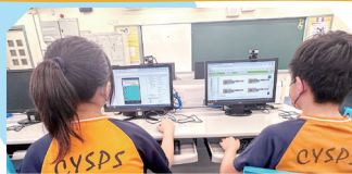
學生在課堂上運用App Inventor應用程式，發揮創意思維。