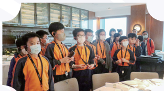
同學親身到酒店認識餐飲部的運作。