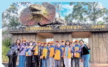
於澳大利亞爬行動物公園 (Australian Reptile Park) 近距離接觸樹熊、袋鼠、蛇等動物。