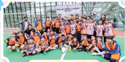
東華三院小學聯校足球同樂日