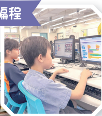
高小學生在專題研習課中，利用Scratch編程，設計宣揚環保禁毒的小遊戲。