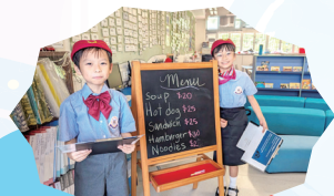
將英語室變成餐廳