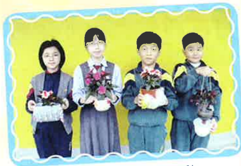
一人一花種植活動

課程的設計，乃根據教育局2002年「基礎教育課程指引」選出首要的七個價值觀，課程宗旨是培養學生在個人及群性發展上建立正確的價值觀和態度，包括堅毅、尊重他人、責任感、關愛、承擔精神、國民身份認同，並結合東華三院院本德育課程，以實踐東華三院校訓的勤、儉、忠、信精神。課程結構以上述價值觀作主題，涵蓋個人、家庭、社會及國家的不同層面，每兩個級別作為一課程組別，每個主題分成三教節，每節三十五分鐘，以大課、成長課題及自訂教材進行施教。各主題配有延伸活動，例如：講座、比賽、服務學習、參觀或交流等，以進一步鞏固學生的價值觀和實踐於生活中。