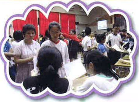
荃葵青小學環保問答比賽