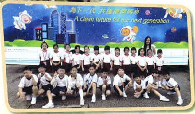
參觀廉政公署展覽車