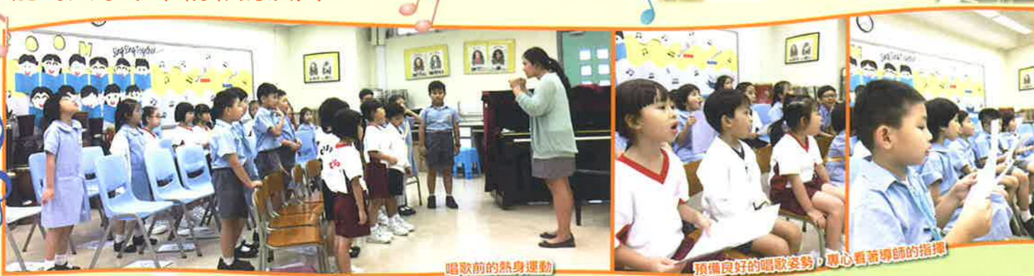
唱歌前的熱身運動